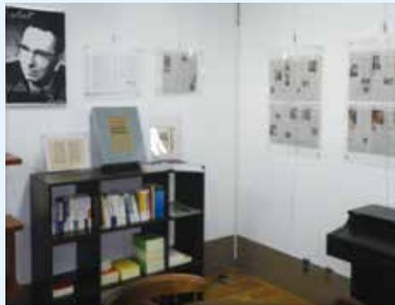
仙台フランクル文庫(ほっぶの森内)